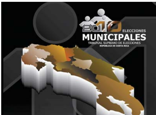
Los usuarios de la página www.tse.go.cr tienen la posibilidad de conocer quiénes serán los candidatos a alcalde de todas las municipalidades del país.

Tanto el fichero cantonal, el fichero del candidato y el programa televisivo "Costa Rica Elige" forman parte del proyecto "Votante informado" elaborado por el IFED, que lo que pretende es que la ciudadanía pueda emitir un voto informado.