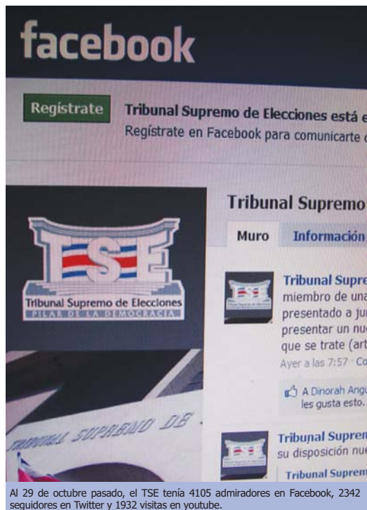
Al 29 de octubre pasado, el TSE tenía 4105 admiradores en Facebook, 2342 seguidores en Twitter y 1932 visitas en youtube.

Desde el pasado mes de enero, el Tribunal Supremo de Elecciones (TSE) cuenta con un espacio dentro de los perfiles de redes sociales donde da a conocer informaciones oficiales relativas a su quehacer institucional, razón por la cual, el pasado 10 de agosto,