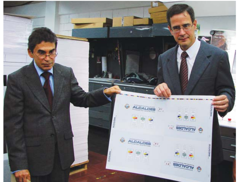
Jorge Vargas, Director de la Imprenta Nacional, en compañía del Magistrado Presidente Luis Antonio Sobrado, muestran a los medios de comunicación la primera papeleta que se imprimió para los comicios del 5 de diciembre.

En las próximas elecciones municipales se elegirán 4 989 puestos municipales: 81 alcaldes, 81 vicealcalde primero y 81 vicealcalde segundo, 473 síndicos propietarios, 473 síndicos suplentes, 1 860 concejales de distrito propietarios, 1 860 concejales de distrito suplentes, 32 concejales municipales de distrito propietarios, 32 concejales municipales de distrito suplentes, 8 intendentes y 8 viceintendentes.