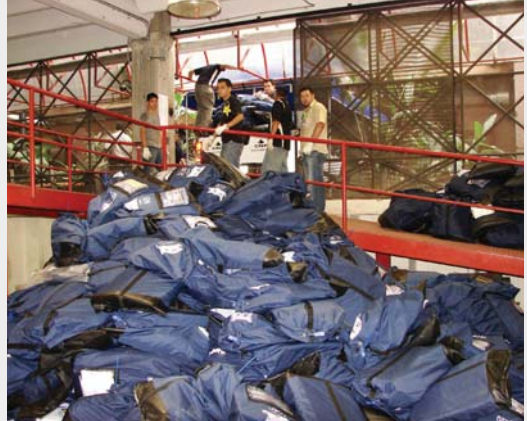
El proceso de reciclaje de 90 toneladas de material electoral tardó dos semanas en concluir.

proceso de eliminación de materiales el TSE se asegura que no aparezcan papeletas auténticas en lugares diferentes a su centro de custodia y destrucción.