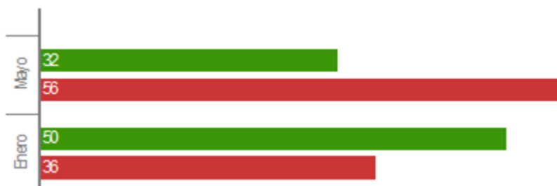
Figura 3: Porcentaje de aprobación de la gestión del presidente Luis Guillermo Solís, (enero y mayo 2015). La República (2015).

Por otro lado, la encuesta de CID Gallup también registra el descenso en el apoyo al presidente.