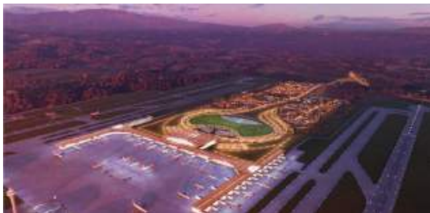
Representación esquemática del proyecto Aeropuerto Internacional Orotina

De nuevo en la modalidad de concesión de obra pública, e iniciando nuestro Gobierno, instalaremos una unidad ejecutora adscrita a casa presidencial, como muestra de la gran importancia que le daremos, con el propósito de retomar el proyecto del Aeropuerto Internacional de Orotina, Iniciaremos las actividades con una agenda ejecutiva de: