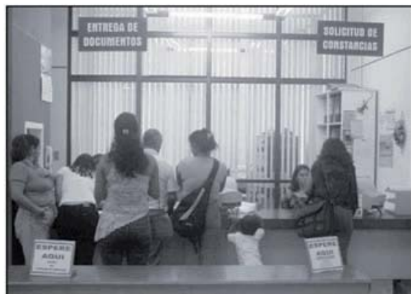
La Regional de Pococí será una de las oficinas que se conectarán próximamente al computador central.

Dentro de las acciones estratégicas a desarrollar en el Plan Estratégico 2008-2012, se pretende conectar todas las Oficinas Regionales al computador Central. Dentro de los beneficios que esto podría generar está la descentralización de la impresión de la cédula con el consecuente aprovechamiento de la capacidad