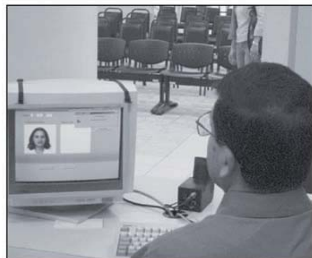
Para este año la institución tiene previsto un crecimiento de solamente 17 nuevas plazas en propiedad.

Un detalle importante a destacar es que, en el presupuesto de este año, hay destinadas 204 plazas para ser utilizadas por 4 meses, solamente si el TSE determina la necesidad de realizar un Referendo sobre el Tratado de Libre Comercio con los Estados Unidos. De esas plazas, 4 serían Asistentes Funcionales, 150 Auxiliares de Operación y 50