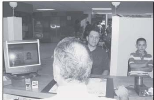
Para renovar los jóvenes no necesitan venir acompañados de un familiar cercano, el trámite es totalmente gratuito y lo que tardan en entregársela es aproximadamente 5 minutos