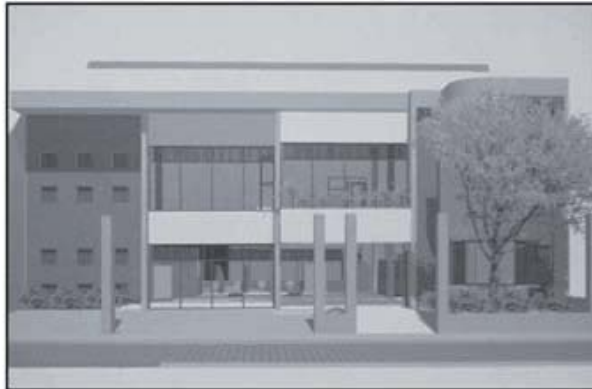
Este es el diseño de la nueva regional de Cartago. En los primeros días de marzo, se firmó el contrato de construcción con la empresa ROCA (Rodríguez Constructores y Asociados) por 167 millones de colones. Solamente hace falta que la Contraloría General de la República refrende el contrato para iniciar la construcción.

Luego de varios intentos por iniciar la construcción de la nueva Oficina Regional de Cartago, todo parece indicar que ahora sí se cumplirá el sueño de poco más de 250 mil habitantes de la zona.