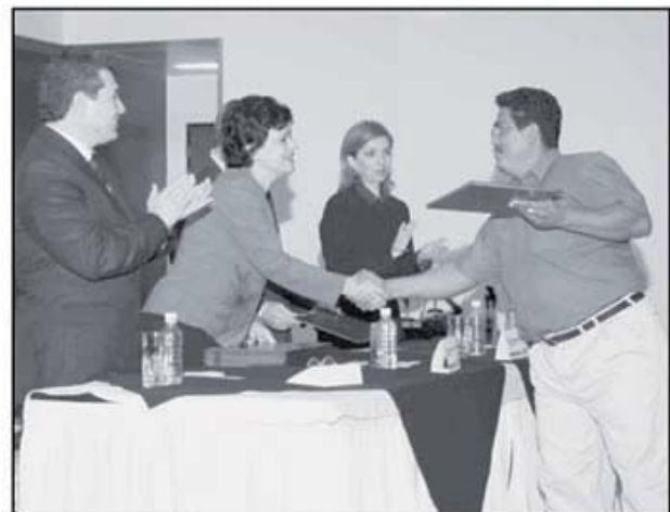
En diciembre del 2006 los costarricenses eligieron 81 alcaldes en todo el país. Y tan sólo tres meses después, el Tribunal Supremo de Elecciones (TSE) ya canceló dos credenciales por renuncia de dos suplentes: uno en Escazú y otro en Alvarado de Cartago.

La normativa municipal indica que el Concejo Municipal podrá convocar a plebiscito para destituir o no a un alcalde municipal. La decisión emanada de esa consulta popular no podrá ser vetada.