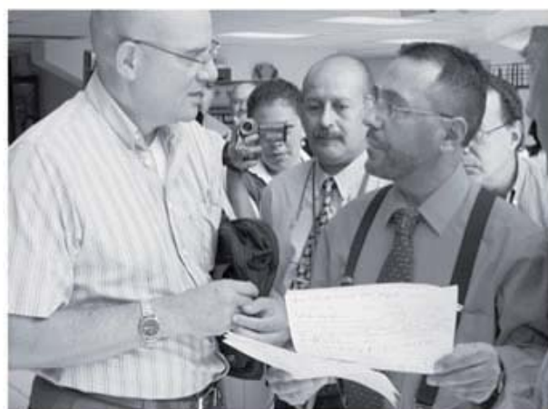
La legislación costarricense prevee que la realización de un referéndum se efectuará un domingo y la votación debe realizarse entre las 6 y las 18 horas. La decisión del votante solamente podrá ser "sí" o "no" o bien, quedar en blanco la respuesta.

El referéndum se efectuará un domingo y la votación debe realizarse entre las 6 y las 18 horas. La decisión del votante