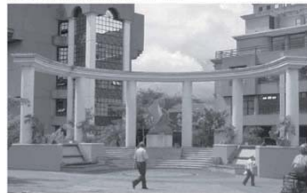
Recientemente el Tribunal Supremo de Elecciones (TSE) giró políticas preventivas sobre el consumo de alcohol y otras drogas con el fin de mejorar sus efectos en el ámbito laboral, sistematizar acciones de prevención integral y la atención del problema.

Durante el este año se capacitará y asesorará al equipo coordinador, también entre los meses de marzo y mayo se informará y sensibilizará a toda la población institucional. Entre mayo y junio se efectuarán sesiones a las jefaturas y durante julio, setiembre y noviembre se realizarán talleres de capacitación al 70% de los funcionarios del TSE.