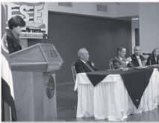
La Magistrada Eugenia Zamora hizo un interesante recuento de la lucha de la mujer a través de la historia. En la mesa principal la acompañan los demás magistrados del TSE.

En el marco de la celebración del Día Internacional de la Mujer, el pasado 6 de marzo el Tribunal Supremo de Elecciones (TSE) hizo pública la Política Institucional para la Igualdad y la Equidad de Género. Para su creación se contó con el apoyo del Instituto Nacional de las Mujeres (INAMU), la Defensoría de los Habitantes, organizaciones no gubernamentales especializadas en la promoción de la equidad de género, organismos internacionales como el Fondo de Población de Naciones Unidas (UNFPA), agencias de cooperación y Ministerio de Educación Pública. UNFPA patrocinó el proyecto.