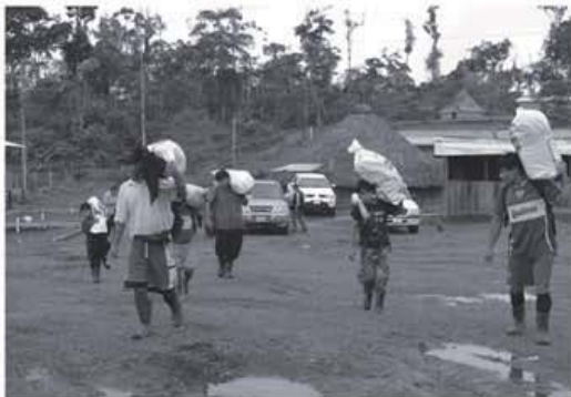
Momento en que estudiantes de la escuela de Nariñak parten de la comunidad de Quetzal hacia su centro educativo. Deben caminar aproximadamente 2 horas para llegar hasta allí.