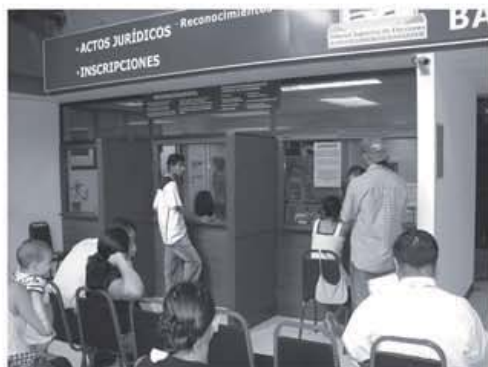
El número de divorcios inscritos en el 2008 disminuyó en un 5% con respecto de los inscritos en el 2007.

El año pasado la Oficina de Inscripciones del Tribunal Supremo de Elecciones inscribió 10.351 divorcios. Dicha cifra disminuyó 5% (575) con respecto a los datos inscritos en el año 2007.