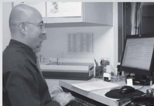
Las políticas de seguridad de la información se compilan en tres documentos de 12 capítulos. Uno va dirigido al personal informático, otro para jefaturas y el otro para los usuarios en general.

Dentro del grupo de políticas de seguridad existen las relativas a los controles de acceso físico, donde se indica que se regulará el ingreso a las diferentes áreas de la institución a fin de que sólo personal autorizado pueda ingresar. Asimismo, la normativa insiste en que mientras un funcionario o una persona del público esté dentro de un área restringida del TSE deberá portar un carné que lo identifique en un