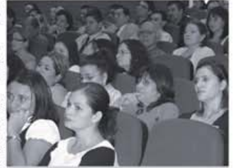
La Política de Género del TSE tiene 4 enfoques: derechos humanos, género, poder y multicultural.

En la presentación también se contó con la conferencista internacional Isabel Torres García, quien disertó sobre "Los avances y desafíos de los derechos políticos de las mujeres". Entre otros cargos, Torres es especialista externa del Observatorio ciudadano de los derechos de las mujeres, iniciativa de la Acade-