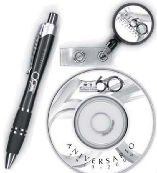
Como parte de la celebración del 60 aniversario, el TSE regalará a cada funcionario un portagafete, un lapicero ergonómico y un disco compacto con la memoria institucional.

También se le envió una nota a Correos de Costa Rica, donde se le pedía la posibilidad de hacer un timbre conmemorativo, pero lastimosamente contestaron que toda la programación del 2009 estaba llena.