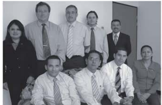
Actual equipo de trabajo de la Auditoría Interna

tración que aplique la normativa que existe. Que planifique con base en la administración de riesgos.