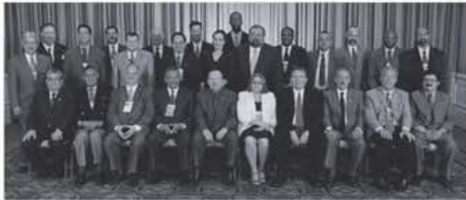
Grupo de Magistrados y participantes de la Conferencia del Protocolo de Tikal celebrada en Costa Rica en el 2003.

• Tema principal será la participación de la mujer en la política