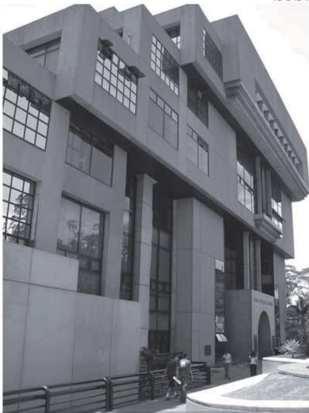
El departamento de Arquitectura del TSE indica que el edificio puede resistir incluso terremotos de más de 8 grados en la Escala de Richter.

Los recientes sismos sentidos en el mes de enero y marzo pasado, hicieron que saltara a la luz el temor de que la infraestructura del edificio del Tribunal Supremo de Elecciones (TSE) sufriera algún daño mayor, que podría perjudicar tanto a los poco más de 600 funcionarios o a los usuarios que estén realizando trámites a la hora de un siniestro.