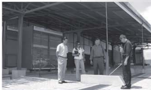
La nueva oficina de Transportes se ubica donde antes estuvo la Quinta Comisaría.

Además, en esa misma Área construirán una escalera de emergencias con salida al Paseo de las Damas, que beneficiará a los compañeros de Artesanías y Encuadernación.