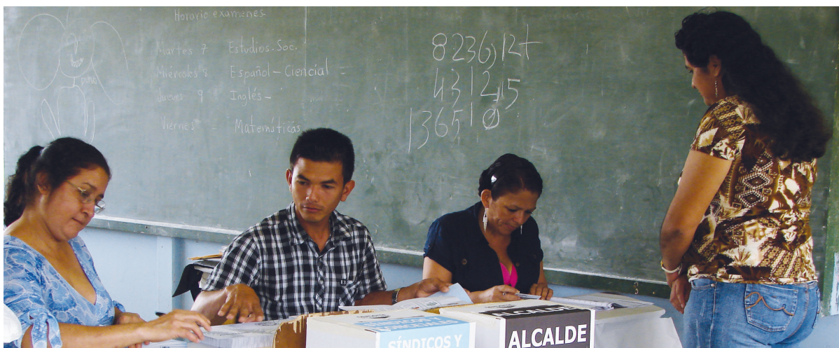
El nuevo reglamento define el número máximo de electores por junta, que será de 700, así como la forma correcta de marcar la papeleta al votar, el voto público, el voto asistido, el horario de votación y el tiempo para votar dentro del recinto electoral.

-Esta elección marca un hito para nosotros, nunca hemos tenido ni 6069 puestos a elegir ni 86 partidos políticos inscritos. Eso nos complica toda la etapa de inscripción de candidatos; el tiempo de más que tardemos inscribiendo candidatos nos va a restar plazos para las etapas subsiguientes, como son impresión de papeletas, empaque de material y distribución de material. Estamos tomando todas las previsiones del caso, pero la incertidumbre al final va a ser cuántas candidaturas se nos van a presentar; y si tendremos que laborar 24/7, habrá que hacerlo.