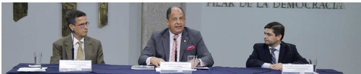
El Presidente de la República, Luis Guillermo Solís (al centro), presentó esta edición conmemorativa. Destacó que este medio de comunicación trasciende los límites de Centroamérica y el Caribe y se potencia como un fuerte instrumento de construcción democrática en todo el hemisferio.

Después agregó: “Estamos frente a una publicación que no solo destaca por su capacidad de incluir valiosos analistas, sino que trasciende los límites de Centroamérica y el Caribe, potenciándose como un fuerte instrumento de construcción democrática en todo el hemisferio”.