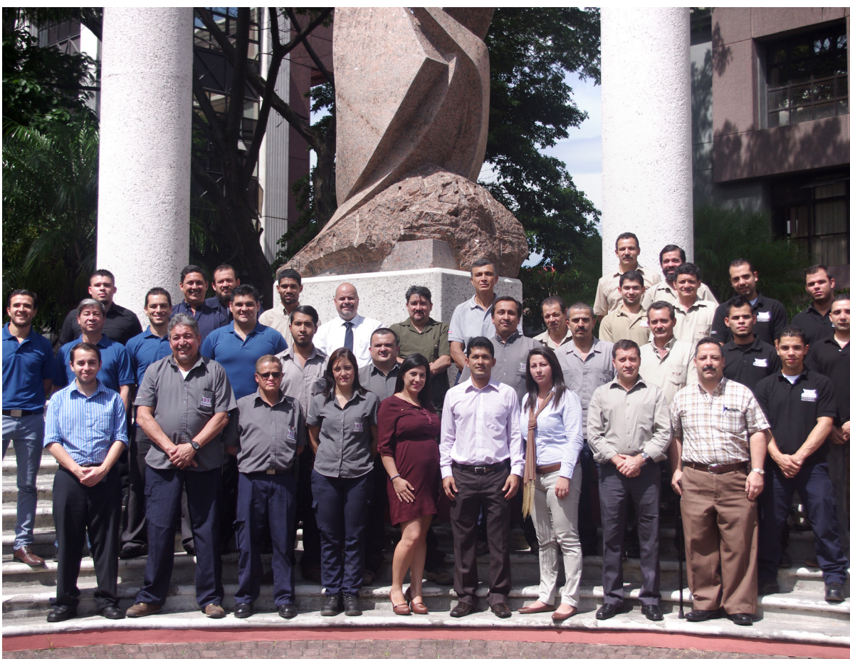
La sección está conformada por 45 funcionarios distribuidos en cinco unidades, las cuales son: Asistencia Técnica, Arquitectura y Diseño, Ingeniería de Instalaciones, Ingeniería Eléctrica e Ingeniería Civil y Construcciones.

Unidad de Ingeniería Civil y Construcciones: lidera las remodelaciones de espacio físico institucional y las acondiciona a las nuevas necesidades.