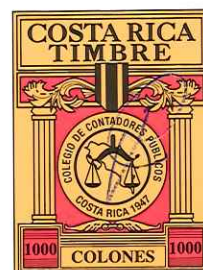
“Timbre de Ley 6663”