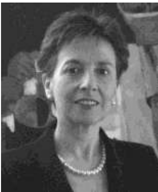
Delia M. Ferreira Rubio